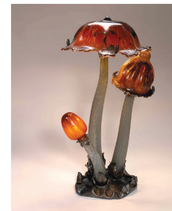
Lampe Les Coprins, Émile Gallé