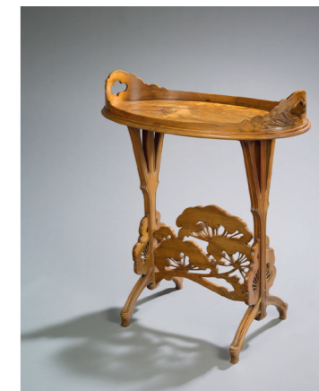
Table Omphales, Émile Gallé